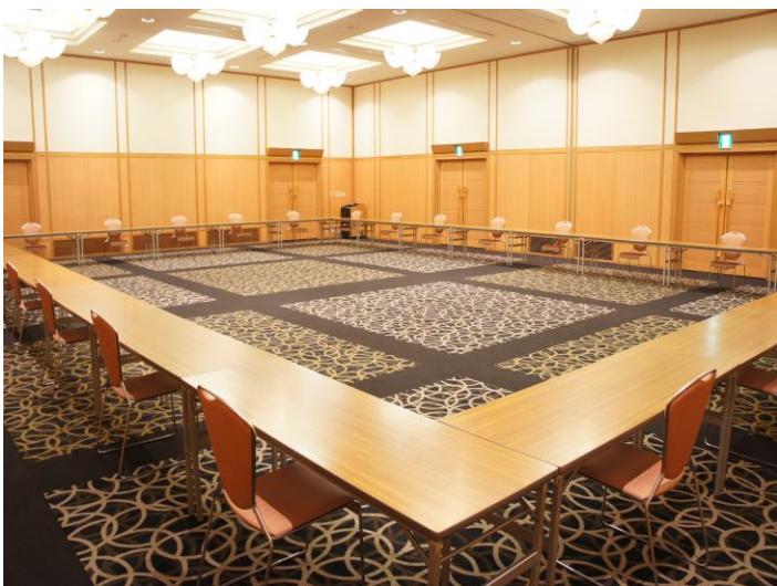
口の字形式 1名掛け