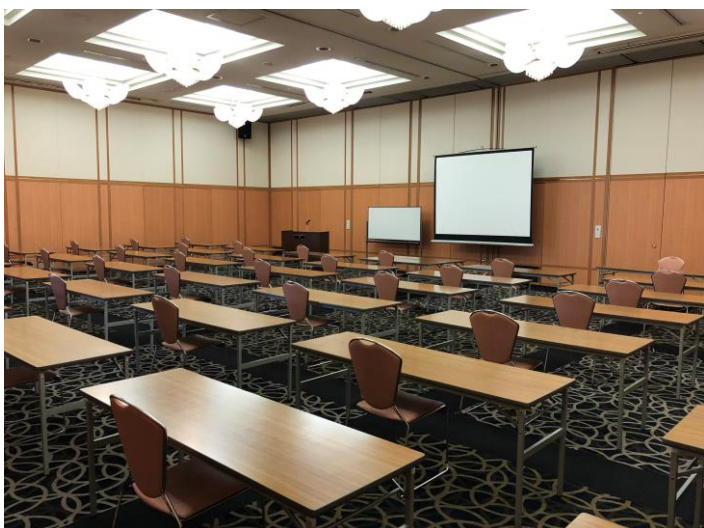
スクール形式 1名掛け